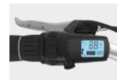
Het compacte LCD display is geïntegreerd in het handvat

Als het om E-Bikes gaat, dan heeft u bij Pointer heel wat te kiezen. Zes verschillende modellen maar liefst, waarbij u per model meestal ook nog allerlei keuze-opties heeft. Nieuw in de Pointer-collectie is de Lyvra, een prachtige E-Bike met een middenmotor en strak design. Deze maakt de Pointer E-Bike collectie compleet. Alle E-Bikes zijn bovendien uitgevoerd met de Pointer Safety Spring, die voorkomt dat het voorwiel onverwacht wegdraait.