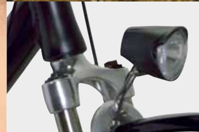
De stijlvolle koplamp van de Primya is voorzien van een naafdynamo