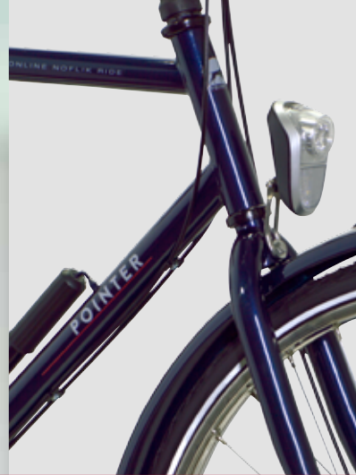
Een echte tijdloze klassieker met een moderne touch