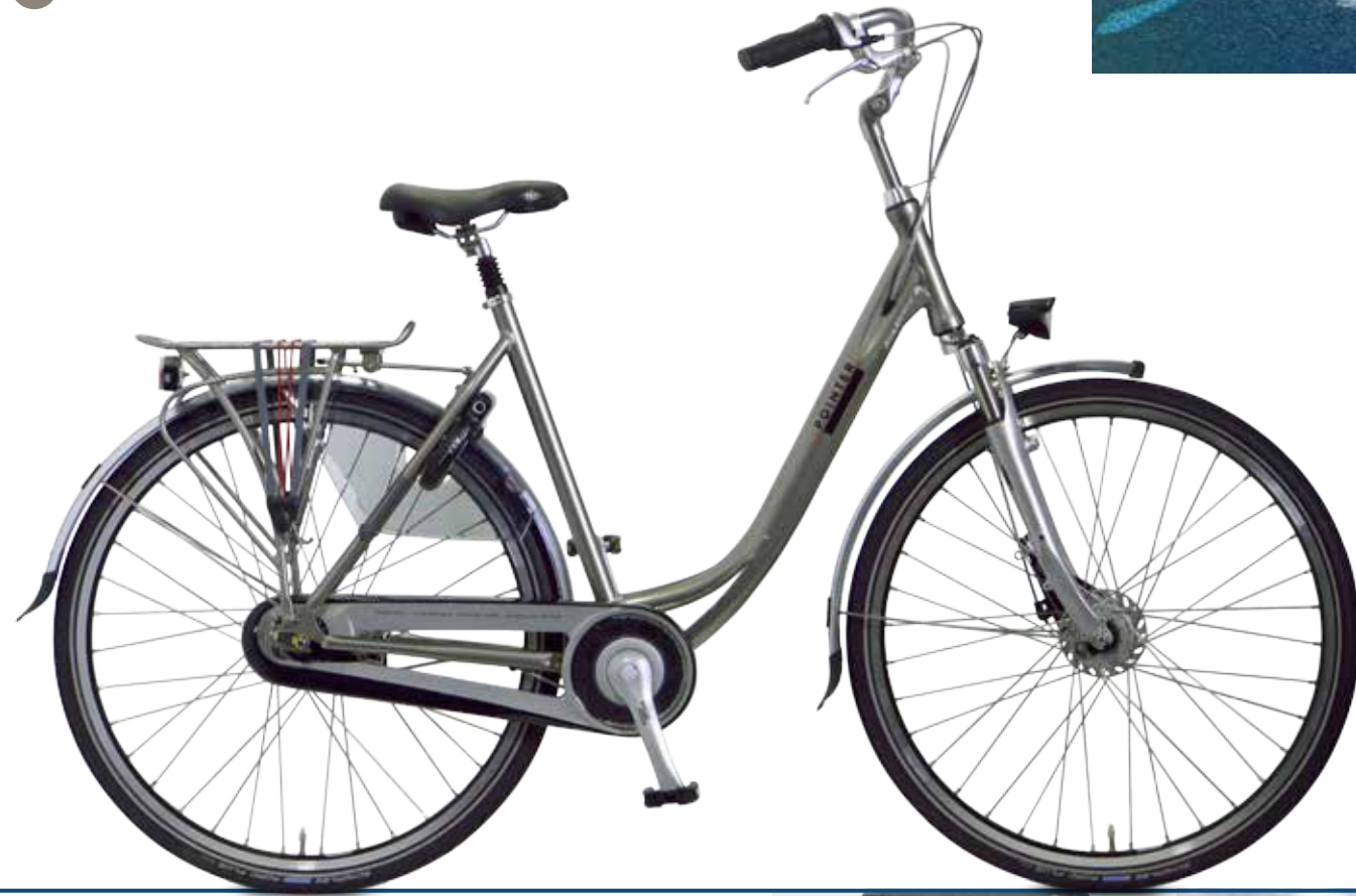
Het fraai vormgegeven achterlicht van de Arena