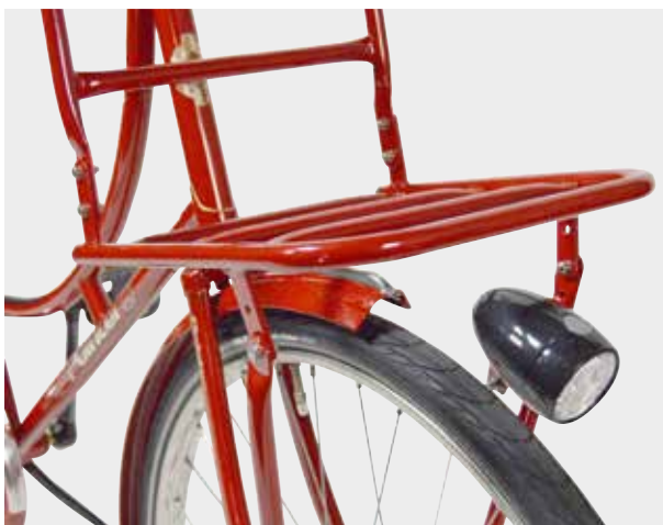
Voordrager als accessoire in kleur leverbaar