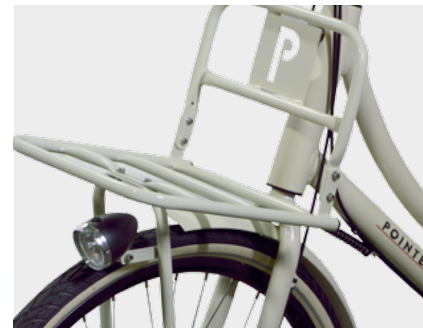
Handige brede voordrager mét Pointer's Safety Spring