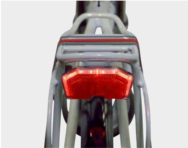
Het fraai vormgegeven achterlicht van de Arena